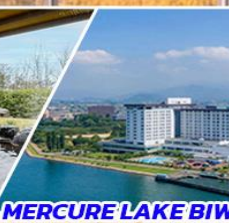
MERCURE LAKE BIWA