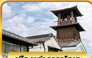
เมืองเก่าคาวาโกเอะ