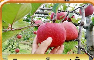
กิจกรรมเก็บแอปเปิ้ล

หอระฆังทาคิโนะ เมืองคุสัทซึ ชมยูมาทาเกะ ฮาคุบะ นั่งกระเช้าชมวิวฮาคุบะอิว่าทาเกะ เมืองคานาซาว่า สวนเคนโรคุเอ็น เมืองฟุกุอิ ซ้อปปิง คารุยซาว่าเอ้าท์เล็ต ซินโซบาชิ อีออน