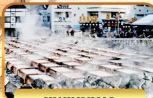
ชมยูมาทาเกะ