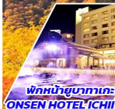
พักหน้ายูมาทาเกะ