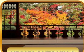
NIIGATA SAITO VILLA