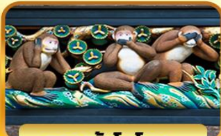
ศาลเจ้าโทโชกุ