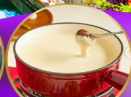
ฟองดูชีส