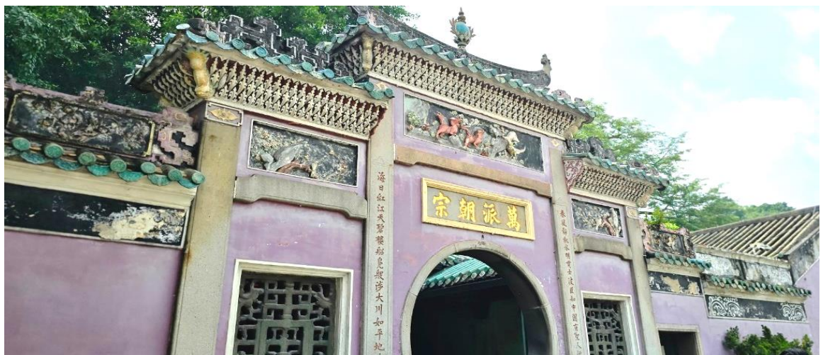
วัฒนธรรมตะวันออกและตะวันตกอย่างลงตัว

นำท่านเดินทางสู่ มาเก๊า (ในการเดินทางข้ามด่าน ท่านจะต้องแลกกระเป๋าสัมภาระของท่านเองและผ่านพิธีการตรวจคนเข้าเมืองใช้เวลาในการเดินประมาณ 45-60 นาที) ในอดีตมาเก๊าเป็นเพียงแค่หมู่บ้านเกษตรกรรมและประมงเล็กๆ ซึ่งเป็นเมืองที่มีประวัติศาสตร์ยาวนาน โดยมีชาวจีนกวางตุ้งและฟูเจี้ยนเป็นชนชาติดั้งเดิม จนมาถึงช่วงต้นศตวรรษที่ 16 ชาวโปรตุเกสได้เดินเรือเข้ามายังคาบสมุทรแถบนี้เพื่อติดต่อค้าขายกับชาวจีน และมาสร้างอาณานิคมอยู่ในแถบนี้ ที่สำคัญ คือ ชาวโปรตุเกสได้นำพาเอาความเจริญรุ่งเรืองทางด้านสถาปัตยกรรม และศิลปวัฒนธรรมของชาติตะวันตกเข้ามาอย่างมากมาย ทำให้มาเก๊ากลายเป็นเมืองที่มีการผสมผสานระหว่าง