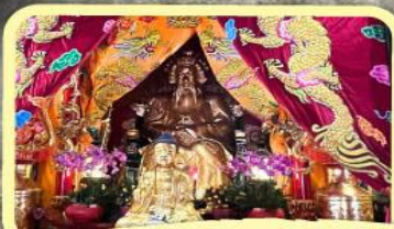
• เอียงบู๊ซิว (ศาลเจ้าพ่อเสือ)