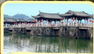
• สะพานโบราณกว้างจี้