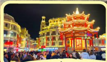
• ถนนโบราณเสียวกงหยวน