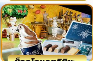
ช็อกโกแลตชิซ