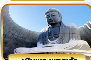
เป็นพระพุทธรเจ้า

05-10, 12-17, 19-24 พ.ย. 26 พ.ย. - 01 ธ.ค. 67