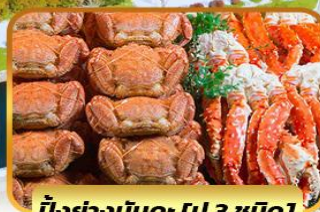
บ๊องย่างมันตะ [ปู 3 ชนิด]