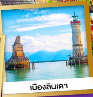
เมืองลินเดา