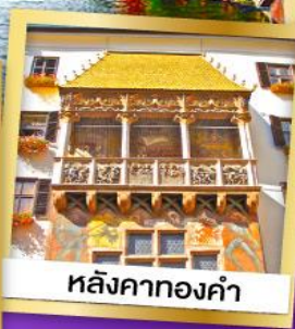
หลังคาทองคำ