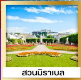
สวนมิราเบล