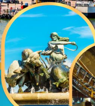
น้ำพุแห่ง ราชินีเกรฟิออน