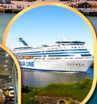
เรือสำราญ TALLINK SILJA LINE