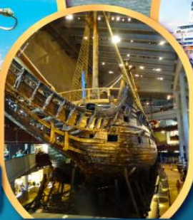
พิพิธภัณฑ์เรือวาซา