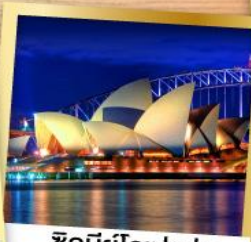
ซิดนีย์โอปอรา