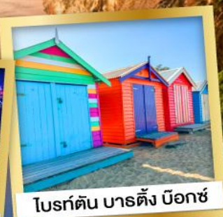
โบรด์ตัน บาร์ตัง บ็อกซ์