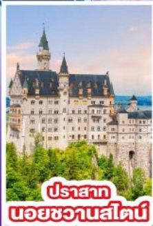
ปราสาท นอยชวานสไตน์