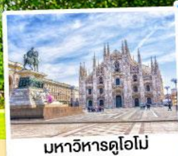
มหาวิหารคูโอม์