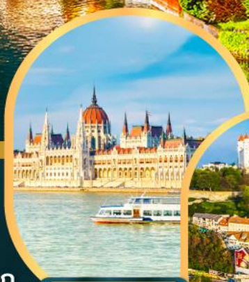
ส่องเรือแม่น้ำดานูบ