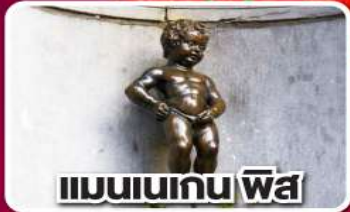
แมนเนเกน ฟิส