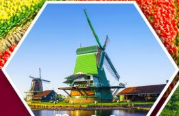
หมู่บ้านกังหันลม ซานส์คินส์