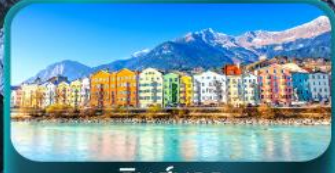
อินส์บรุค