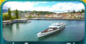
ล่องเรือทะเลสาบลูซิิร์น