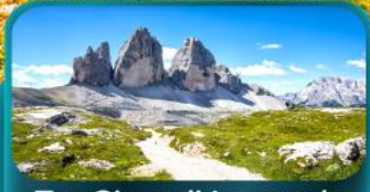
Tre Cime di Lavaredo