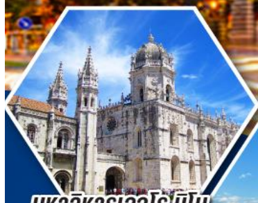
มหาวิหารเจโรนิโม