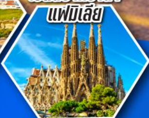
โบสถ์ซากราดา แฟมิเลีย