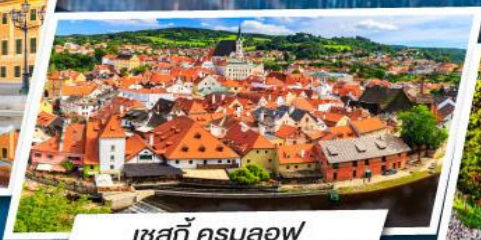
เชสกี คุรมลอฟ