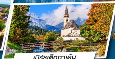
เบิร์ชเตกกาเดิน