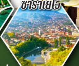
ซาราเยโว

• หนึ่งกระเช้าสู่ยอดเขาคูบรอฟนิค • ซิมphonyนางรมสดๆ เมืองสตอน