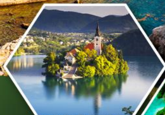
ทะเลสาบเบลค