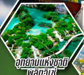
อุทยานแห่งชาติ พลิทวีเซ่