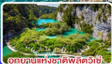
อุทยานแห่งชาติพลิตวิเช่