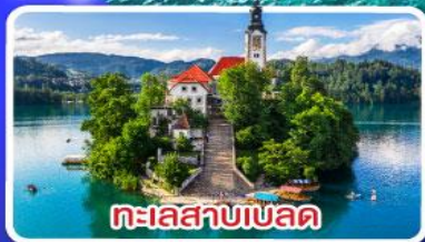
ทะเลสาบเบลลด์

ไข่มุกแห่งอาเดรียติก พร้อมขึ้นกระเช้า SRD