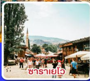
ซาราเยโว