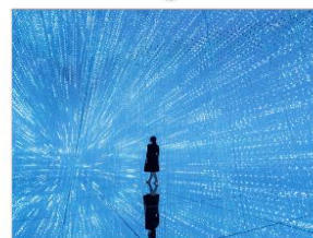
ทิมแล็บแพคนเน็ต