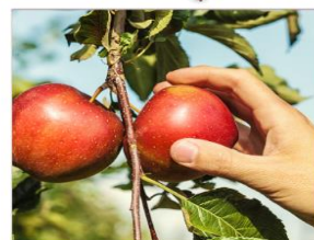
กิจกรรมเก็บแอปเปิ้ล