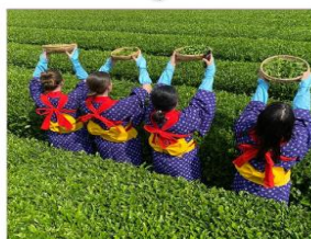
กิจกรรมเก็บชาみやโนะเซ็น