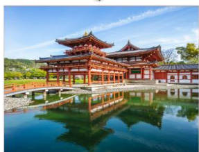
วัดเม็ยวโดอินและ ถนนซาเงียว