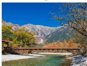
ดามิโดจิ