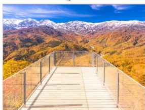
นั่งกระเช้าฮาคุมะ