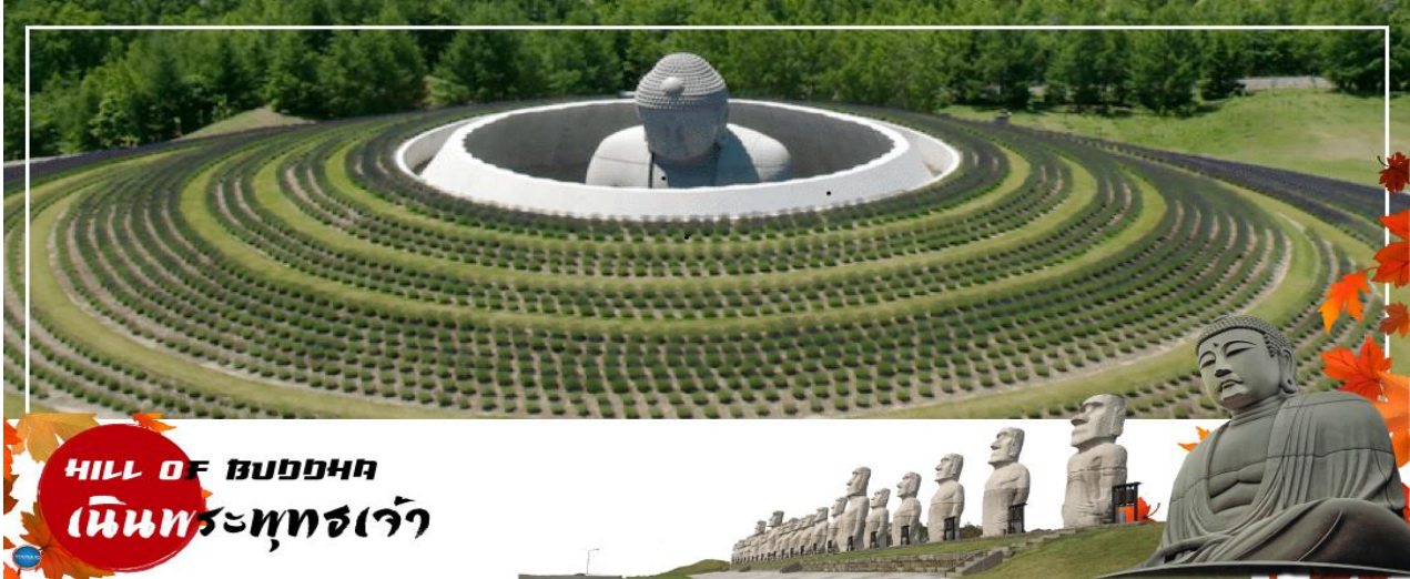
HILL OF BUDDHA เนินพระพุทธรเจ้า

วันที่สี่ เมืองซัปโปโร – เนินพระพุทธรเจ้า – เมืองโจซังเค – ชมสะพานแขวนฟุตามิ สิริบาชิ – สวนโจซังเคเก็นเซน – เมืองซัปโปโร – นั่งกระเช้าชมวิว ณ ภูเขาโมอิวะ – ย่านซูซุกิโนะ