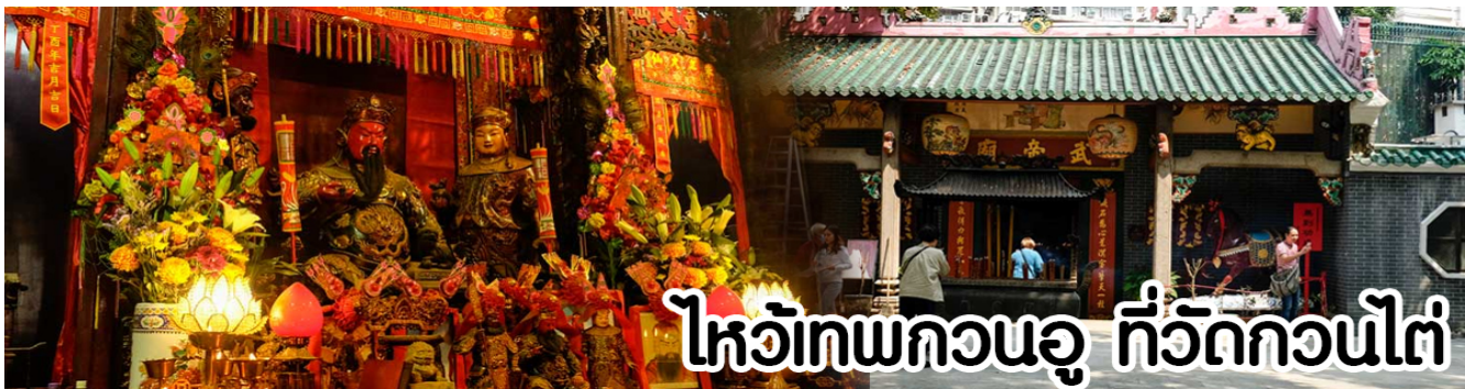
ไหว้เทพกวนอู ที่วัดกวนไต่

หลังจากนั้นขอพรเทพเจ้ากวนอู ณ วัดกวนไต่ วัดเก่าแก่สร้างขึ้นในปี.ศ. 2434 เป็นวัดเดียวในเกาะลูนที่บูชาเทพ เจ้ากวนอูเป็นเทพผู้ยิ่งใหญ่ เทพเจ้าแห่งความซื่อสัตย์ โชคลาก บารมี