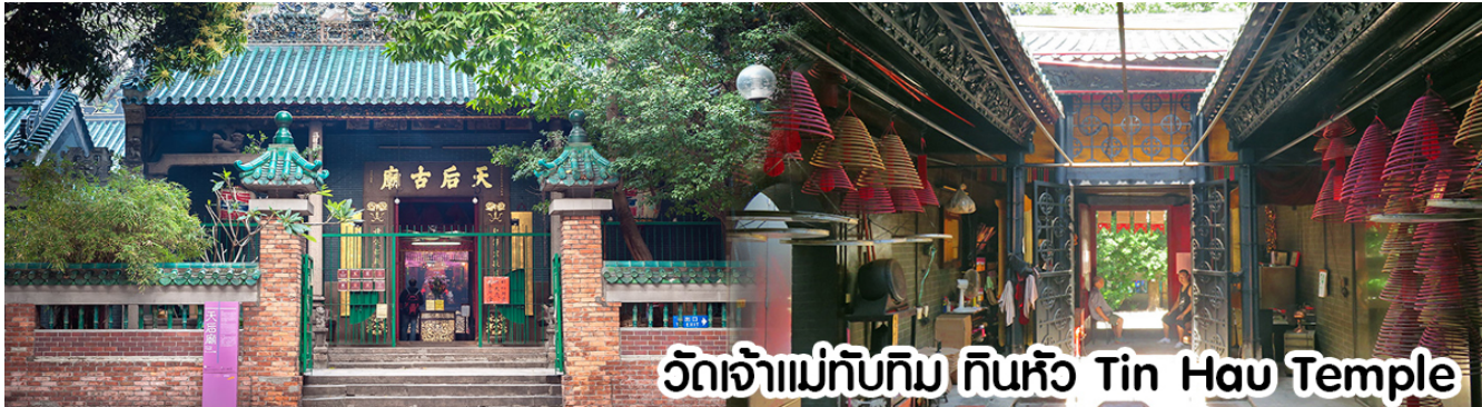
วัดเจ้าแม่ทับทิม ทินหัว Tin Hau Temple

หลังจากนั้นขอพรเทพเจ้ากวนอู ณ วัดกวนไต่ วัดเก่าแก่สร้างขึ้นในปี.ศ. 2434 เป็นวัดเดียวในเกาะลูนที่บูชาเทพ เจ้ากวนอูเป็นเทพผู้ยิ่งใหญ่ เทพเจ้าแห่งความซื่อสัตย์ โชคลาก บารมี