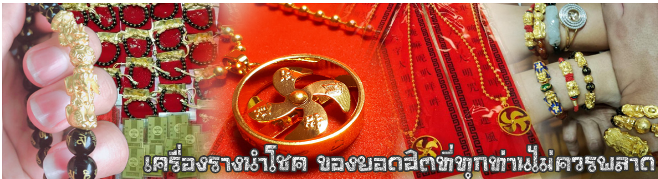
เครื่องรางนำโชค ของยอดฮิตที่ทุกท่านไม่ควรพลาด

จากนั้นนำท่านสู่ ร้านหยก ชมความงามปีเซี่ยะ ที่เชื่อกันว่าเป็นวัตถุมงคลยอดเยี่ยม ที่มีการนำมาบูชา เพื่อให้ช่วยป้องกันสิ่งชั่วร้าย เรียกรทรัพย์สินเงินทองให้ไหลมาเทมา และกักเก็บทรัพย์นั้นไม่ให้รั่วไหลออกไปไหนได้ ชาวจีนโบราณเชื่อกันว่า ปีเซี่ยะเป็นสัตว์ประหลาดที่รวมลักษณะของสัตว์มงคลทั้ง 5 ชนิดไว้ด้วยกัน ได้แก่ มังกร พญาราชสีห์หรือสิงโต, อินทรี, กวาง, และแมว โดยตามตำนานเล่าว่า ปีเซี่ยะเป็นลูกมังกรตัวที่ 9 (เทพแห่งโชคลาภ) ของพญามังกรสวรรค์ มีชื่อเรียกด้วยกันหลายชื่อไม่ว่าจะเป็น “เทียนลก (กวางสวรรค์)” เป็นชื่อเดิม ส่วนจีนกวางตุ้งจะเรียกว่า “เผ่าย่า” และคนจีนแต้จิ๋วจะเรียกว่า “ผีซิว”และ ยังมีจำหน่ายยาสมุนไพรบำรุงเพิ่มความแข็งแรงตามความเชื่อของคนฮ่องกง