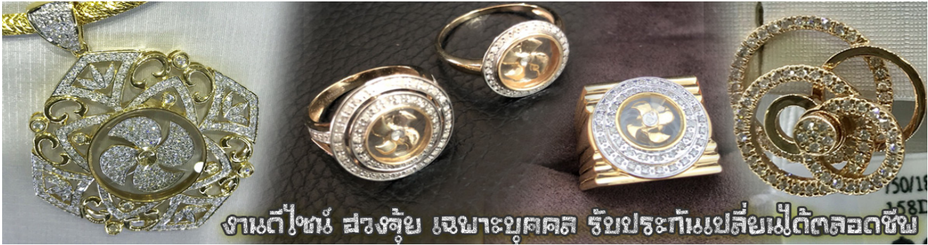
งานดีไซน์ สรรงคู่ขุญ เจษาะบุคคส รัชประภักเมเป็ลี่ยเม็ดัดตลอดชีพ

นำท่านเยี่ยมชม โรงงานจิวเวลรี่ ที่ขึ้นชื่อของฮ่องกงพบกับงานดีไซน์ที่ได้รับรางวัลอันดับยอดเยี่ยม และใช้ในการเสริมดวงเรื่อง ฮวงจุ้ยนำความโชคดี มั่งคั่งแก่ผู้สวมใส่ ซึ่งในเมืองไทยก็ได้นิยมแพร่หลายออกไป ไม่ว่าจะเป็นกลุ่ม ดารา นักการเมือง พ่อค้าแม่ขายที่ประกอบธุรกิจ เจ้าของกิจการห้างร้านต่าง ๆ ซึ่งเชื่อกันว่าจะนำสิ่งดี ๆ ปิดเป่าสิ่งชั่วร้ายให้กับบุคคลที่สวมใส่ ซึ่งจะมีมากมายหลายชนิด เช่นจี้กั๊กกัน แหวนรุ่นต่าง ๆ นาฬิกาข้อมือ (ซึ่งผู้สวมใส่จะได้รับการดูอายุจากซินแสประจำร้าน เพื่อนำวิธีการเสริมดวงในการสวมใส่โดยไม่ติดต่อบริการ)