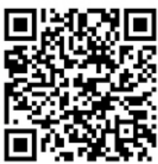
Photo Requirements for Chinese Visa Application