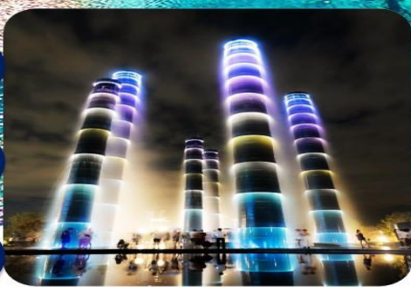
ห้าง SKP Chengdu