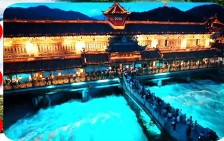
เมืองโบราณฉู่เจียงเยี่ยน