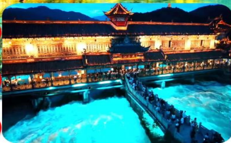
เมืองโบราณตูเจียงเยียน