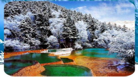
อุทยานมู่หนี่โกว

แบบพิเศษ สุก๊ทม่าล่า บุฟเฟต์ ดันตำรับเสฉวน