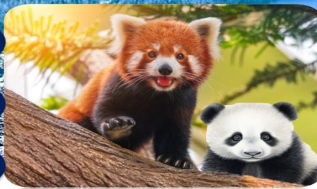
ศูนย์วิจัยหมีแพนด้า