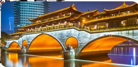
เมืองโบราณตุเจียงเยียน