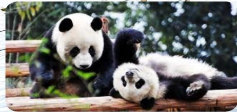
ศูนย์วิจัยหมีแพนด้า