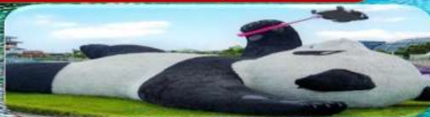
แพนด้าเซลฟี่