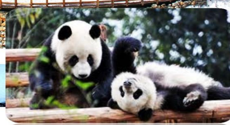
ศูนย์วิจัยหมีแพนด้า

เมนูพิเศษ สุกี้หม่าล่า บุฟเฟต์ / เปิดปากก๊อง