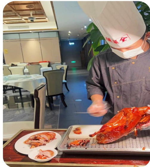
เมนูพิเศษ เป็ดปักกิ่ง

จากนั้นนำท่านเที่ยวชม ถนนโบราณความง่าย แปลเป็นไทยได้ใจความ “ชอยกว้างชอยแคบ” เหมือนพาท่านย้อนกลับไปสู่เมืองจินโบราณแต่ผสมผสานกับความทันสมัยเข้าไปได้อย่างลงตัว ถนนคนเดินมี 3 ชอย แต่ละชอยมีความยาวประมาณ 400 เมตร มีร้านค้าเล็กๆ ตั้งเรียงรายอยู่ในแต่ละชอยและตรอกให้เดินช้อปปิ้งเพลิน ให้ท่านได้เลือกซื้อ