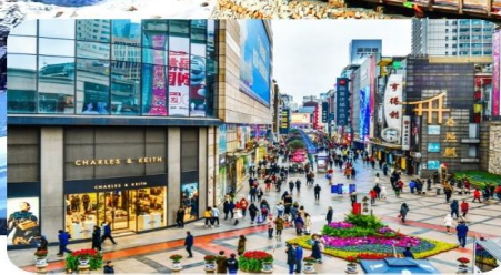
ถนนคนเดินชุนซีลู่