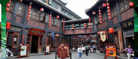
ถนนโบราณจิ้งหลี่

เมนูพิเศษ สุกี้หม่าล่า 6 วัน 5 คืน เดินทาง : เทศกาลสงกรานต์ สุกี้เห็ด ชาบูไม่อื่น