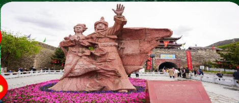
เมืองโบราณชงพาน