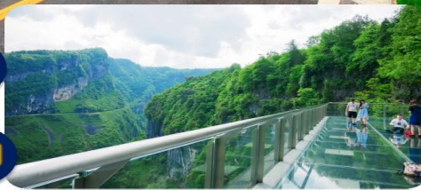
ระเบียงกระจกอู่หลง