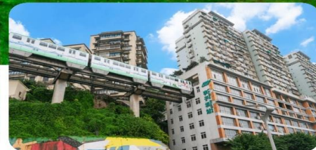
รถไฟทะเลตึก