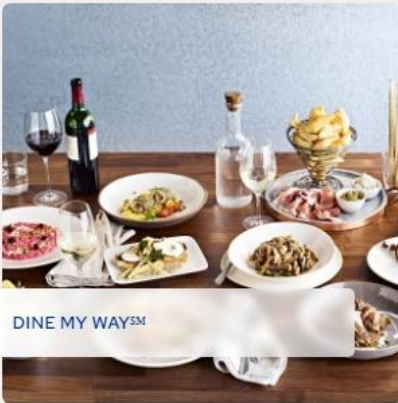
DINE MY WAY SM