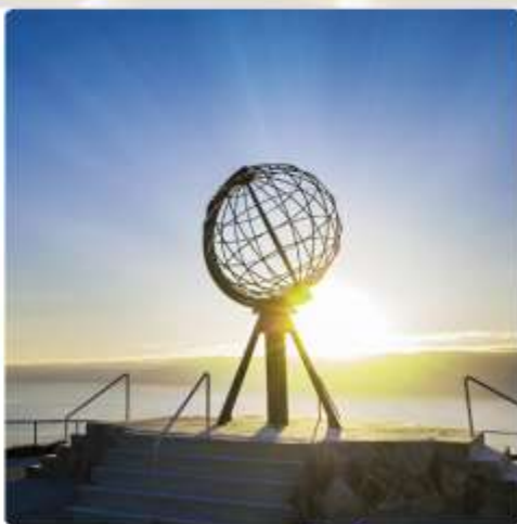
สับผัสติณแดนไว์กิงซม พระอาทิตย์เที่ยงคืน