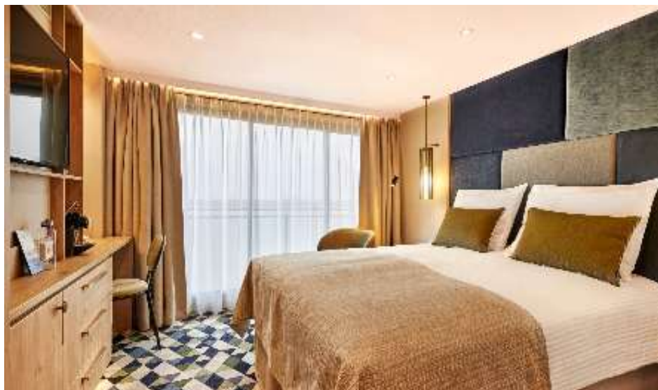
Double Cabin 17 m 2