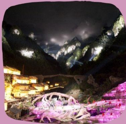
โซ่วจิ้งจอกขาว