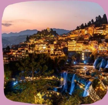
เมืองโบราณฟงรงเจิ้น