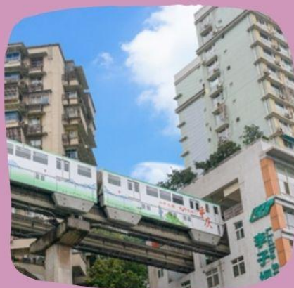
รถไฟทะลุตึก