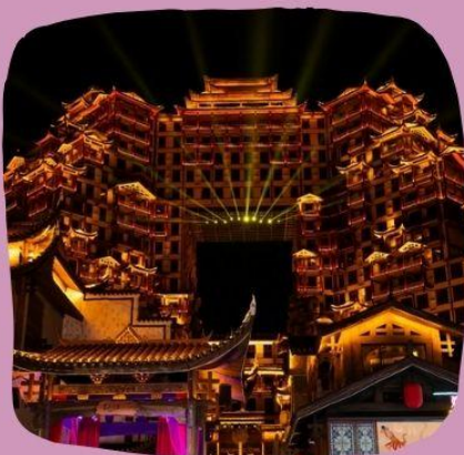
ตึกมณฑลจรรยา 72 ชั้น