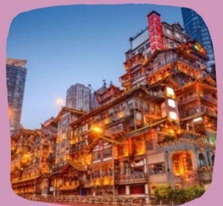
หงษ์ย้าตาง

ราคานี้รวม: ค่าเข้าสถานที่ต่างๆ โซ่วสุดอลังการณ์ แต่งตัวชุดจีนโบราณ