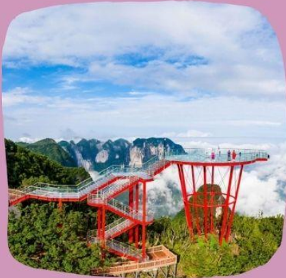
ภูเขาเจ็ดตาว