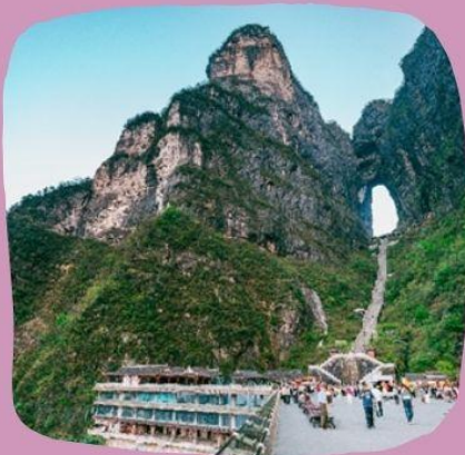
เขาเทียนเหมินชาน