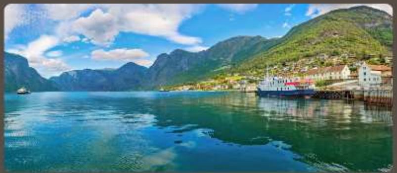
เส้นทางแสนสวย เมืองน่ารัก อากาศดีเยี่ยม

ทัวร์สแกนดิเนเวีย 10 วัน ชมทัศนียภาพที่สวยงามในการสัมผัสประสบการณ์แบบสแกนดิเนเวีย เริ่มต้นด้วยทัวร์เที่ยวชมเมือง โคเปนเฮเกน สวีเดน มาร์ก นอร์เวย์ ฟินแลนด์ และสวีเดน ในแต่ละจุดหมายปลายทาง การเดินทางด้วยรถไฟโค้ช รถไฟ ชมวิว และล่องเรือชมวิฟยอร์ด สัมผัสประสบการณ์หมู่บ้าน ภูเขา และชนบทของเส้นทางในรูปแบบที่แตกต่างกัน พร้อมกับลิ้มรสอาหารท้องถิ่นหลากหลายเมนู