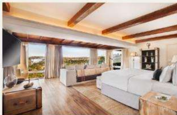
Hotel das Cataratas, A Belmond Hotel