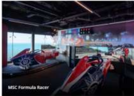
MSC Formula Racer