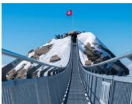
พิชิตยอดเขากิตลิส (Titlis Mt.)

โดยชื่อ Benelux มาจากการนำตัวอักษรแรกของแต่ละประเทศมา ผสมกัน BE:Belgium, NE:Netherlands, LUX: Luxembourg ก่อตั้งขึ้นครั้งแรกในฐานะ สหภาพศุลกากร เมื่อปี ค.ศ. 1944 เพื่อส่งเสริม ความร่วมมือทางการค้าและเศรษฐกิจระหว่างกัน กลุ่มเบเนลักซ์ ถือเป็นคนต้นแบบสำคัญที่นำไปสู่การก่อตั้งสหภาพยุโรป EU ในเวลา ต่อมา