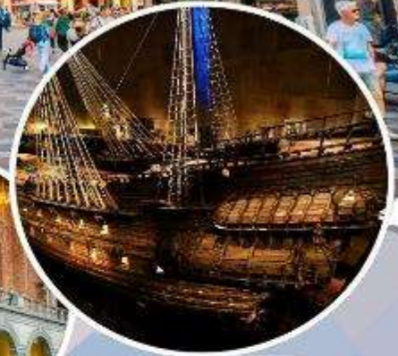
เข้าชม "พิพิธภัณฑ์เรือวาซา"