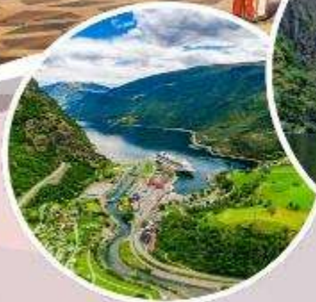
นั่งรถไฟสายโรแมนติก "Flamsbana"