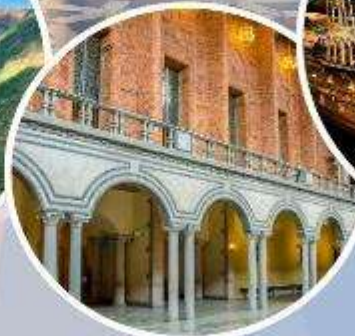
เข้าชมศาลาว่าการ กรุงสต็อกโฮล์ม