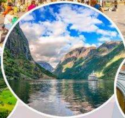
ล่องเรือ "Nærøysfjord"