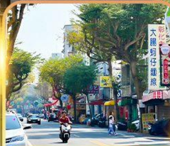
ถนนโบราณอันผิง