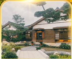
หมู่บ้านสไตลล์ญี่ปุ่นเจียงจุนฝู