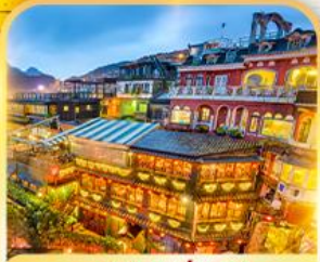
หมู่บ้านจิวเฟิน