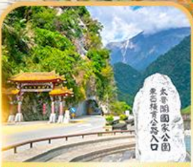
อุทยานไทโรโกะ(ด้านหน้า)