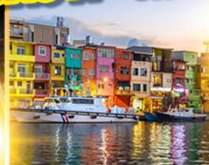
หมู่บ้านประมงเจินปิง