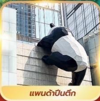
แพนด้าปีนตึก