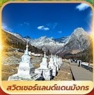
สวิตเซอร์แลนด์แดนมังกร