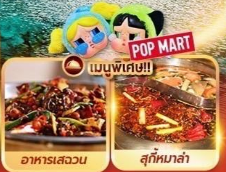
อาหารเสฉวน