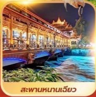
สะพานหนานเจียว