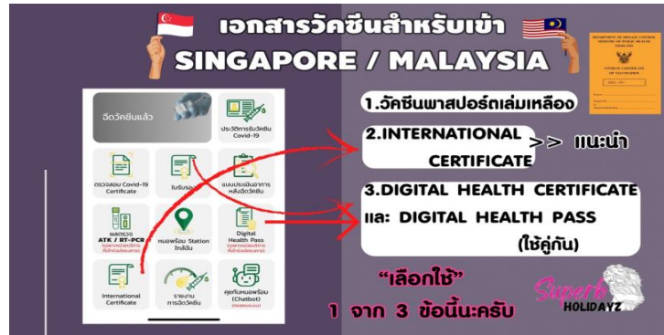
International Covid19 Vaccination Certificate

ไม่รวมค่าทิปไกด์+ค่าทิปคนขับรถเหมาจ่ายท่านละ 1,500 บาทชำระที่สนามบินสุวรรณภูมิ (ไม่รวมค่าทิปหัวหน้าทัวร์ตามความพึงพอใจ)