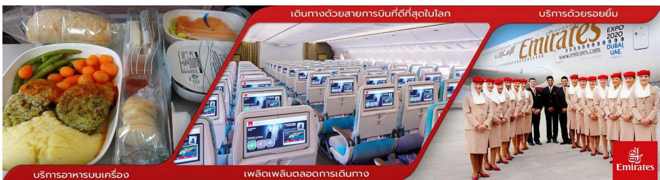
บริการอาหารบนเครื่อง

04.45 น. เดินทางถึง สนามบินนานาชาติดูไบ ประเทศสหรัฐอาหรับเอมิเรตส์ เพื่อแวะเปลี่ยนเครื่อง