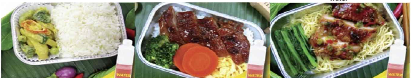
Chicken roasted with herb and noodle and water