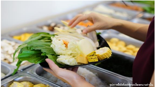
รูปภาพใช้เพื่อประกอบโฆษณาเท่านั้น