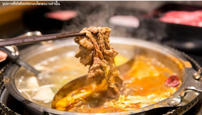
รูปภาพใช้เพื่อประกอบโฆษณาเท่านั้น

๓๑ บริการอาหารค่ำ ณ ร้านอาหาร พิเศษ!! เมนู บุฟเฟต์ชาบูไต้หวัน