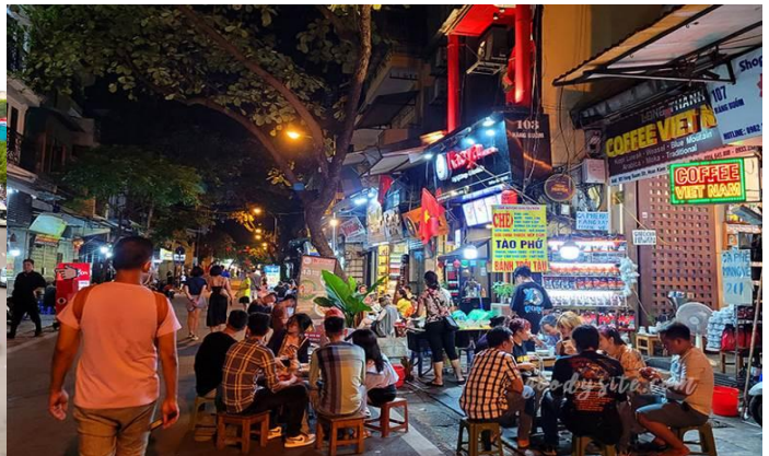
ค่ำ รับประทานอาหารค่ำ ณ ภัตตาคาร (8)

นำท่านเข้าสู่ที่พัก MOON VIEW HOTEL , HONG HA HOTEL , ระดับ 3 ดาว หรือเทียบเท่า